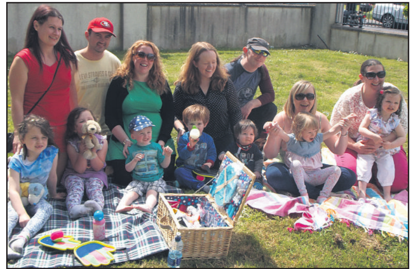
Pic an tSamhraidh ag an ngrúpa SPRAOI anuraidh

Is grúpa dátheangach é SPRAOI a thagann le chéile go rialta chun deis a thabhairt do thuismitheoirí agus páistí súgradh le chéile trí Ghaeilge. Bunaíodh an grúpa i Samhradh 2012 agus tá sé ag dul ó neart go neart ó shin. Bíonn fáilte roimh theaghlach nua i gcónaí agus níl brú ar éinne ach an méid Gaeilge atá acu féin a labhairt. Cuirfear fáilte roimh chách ag Picnic an tSamhraidh ar an Satharn