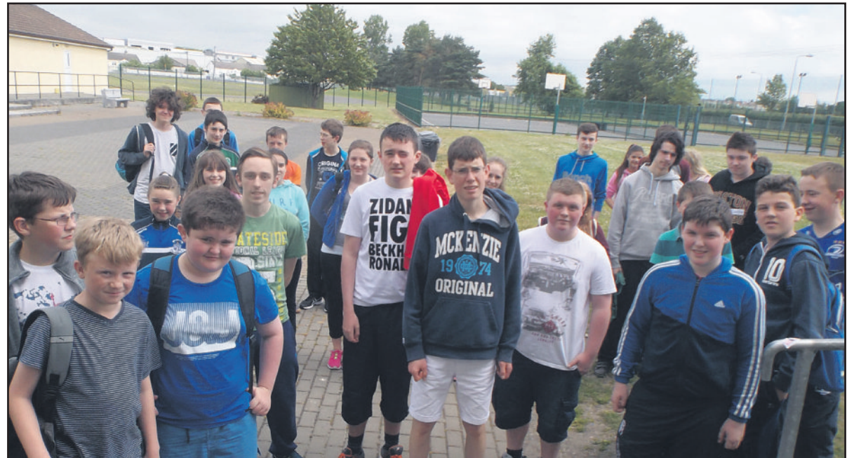
Cuid de na déagóirí ar a mbealach isteach sa Choláiste Samhraidh

Tá an Coláiste Samhraidh do dhéagóirí i gCeatharlach faoi lán seoil. Is í seo an 7ú bliain den choláiste agus tá suas le caoga dalta ag freastal ar an gcúrsa coicise eagraithe ag Glór Cheatharlach agus ar siúl sa Ghaelcholáiste. Tá an cúrsa oiriúnach do dhéagóirí i Rang 6 go Bliain 6 agus leanfar leis go De hAoine na seachtaine seo. Chomh maith leis na ranganna tá cluichí teanga agus díospóireachtaí, cluichí agus sport, amhránaíocht agus ranganna céilí ar chlár an chúrsa.